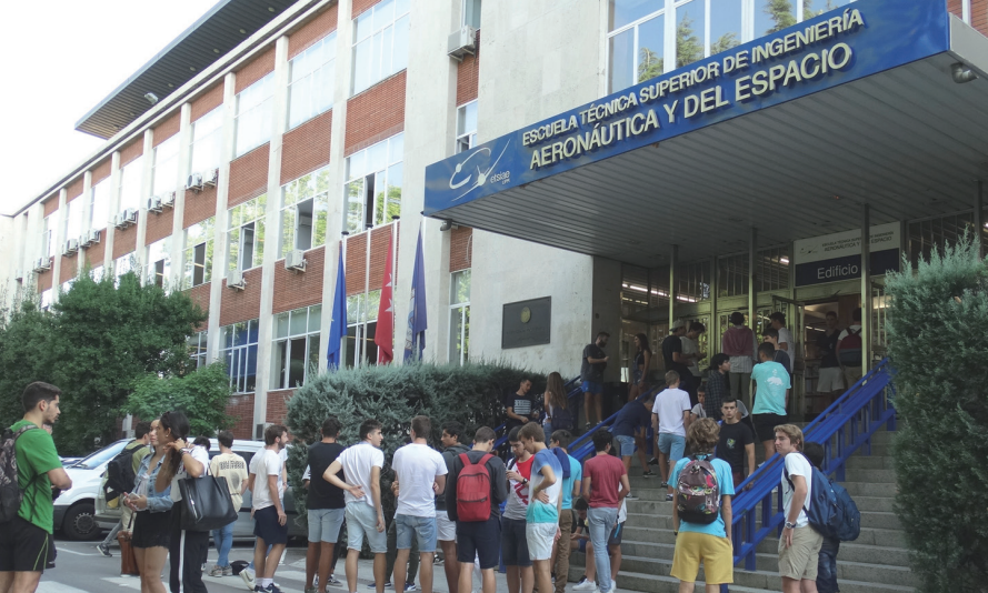
Fachada de la Escuela Técnica Superior de Ingeniería Aeronáutica y del Espacio.